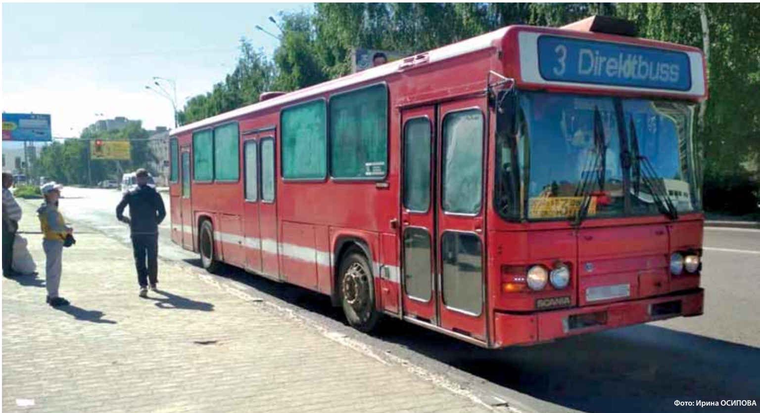
На субсидирование межобластных маршрутов бюджет в этом году выделил 481 млн тенге. На социально-значимые городские маршруты средств нет.

«Упразднение данной льготы является нарушением договорных обязательств и влечет за собой расторжение договора на обслуживание маршрута. Руководству ТОО «Автотранспортный цех «БЭСТ» городским отделом ЖКХ было направлено соответствующее уведомление. При выявлении нарушений, и если они не будут устранены в течение 30 дней, договор будет расторгнут. Уже сейчас ведутся переговоры с другими перевозчиками, которые продолжат работу на маршрутах в порядке