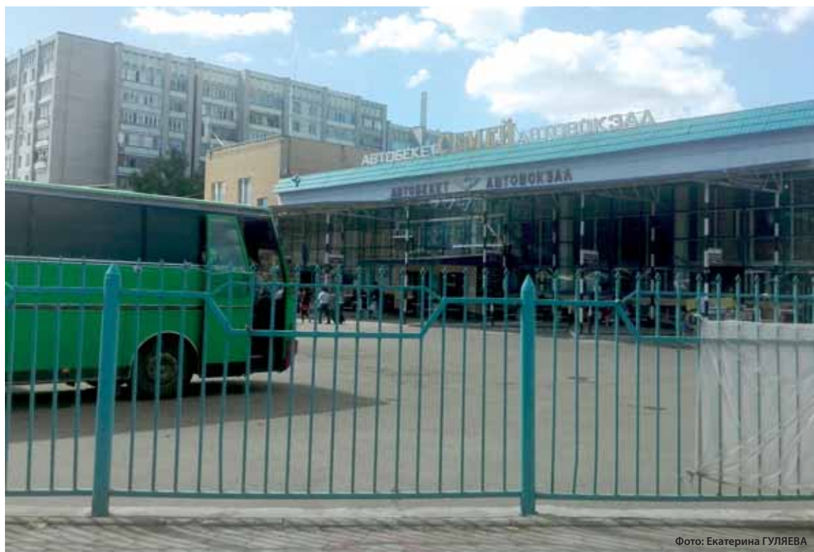
Земельный участок в центре Семья был продан за 14,6 млн тенге.

«В июне 2018 года, рассмотрев заявление ТОО «Семей-Автовок-