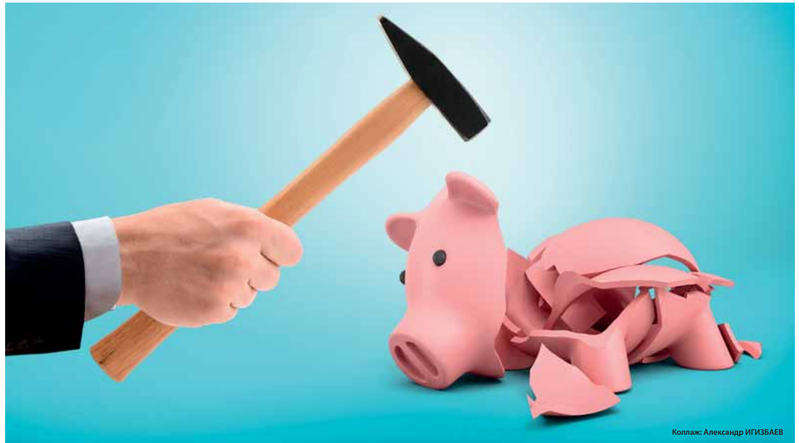
Коллаж: Александр ИГИЗБАЕВ

Согласно данным реестра налогоплательщиков, ТОО «Тазалык Эксперт» зарегистрировали в органах госдоходов за полтора месяца до организации электронных торгов. В 2018 году компания