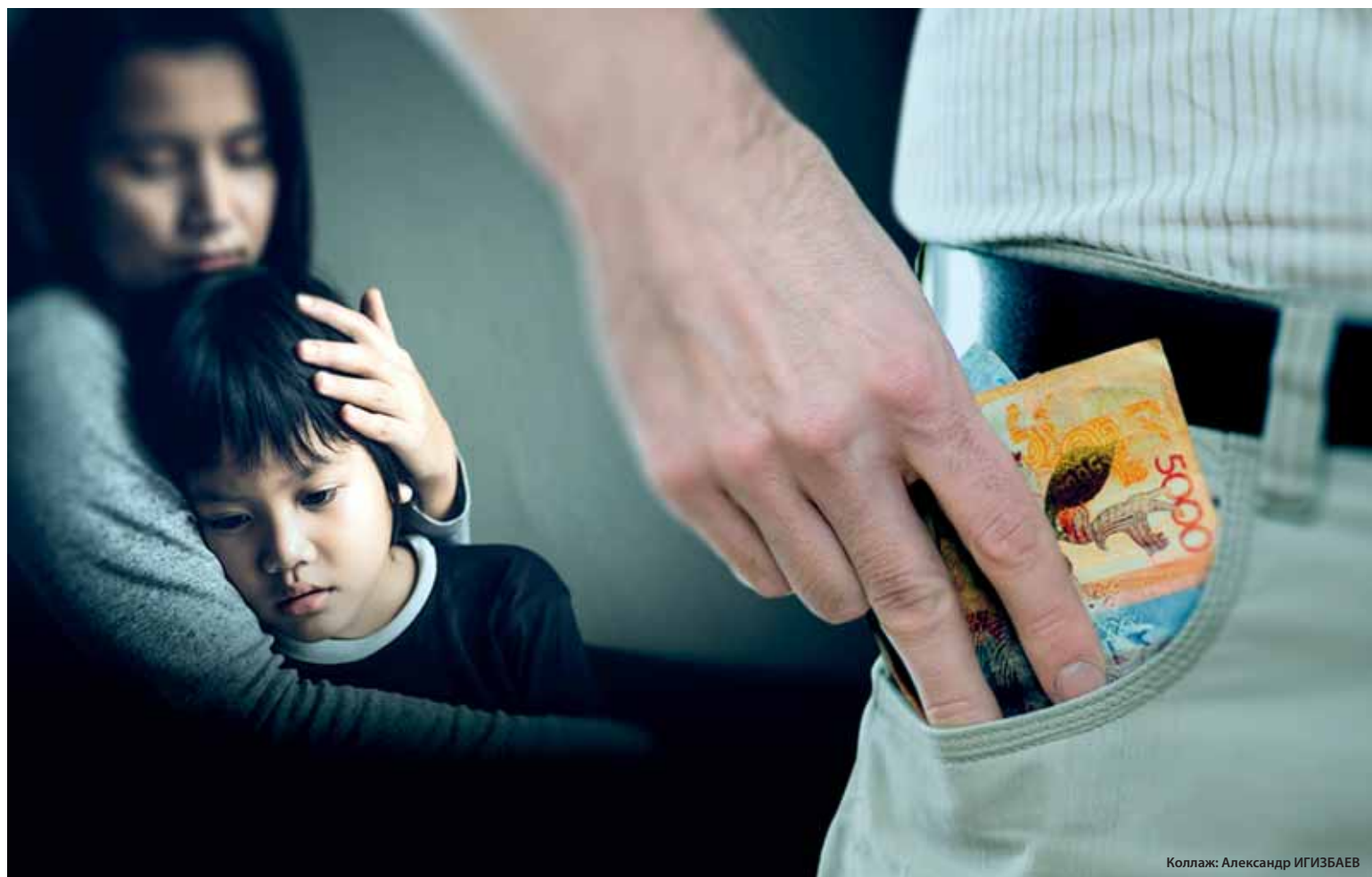
Коллаж: Александр ИГИЗБАЕВ

Как признают специалисты, ситуация по таким категориям дел сложная. В департаменте юстиции эти исполнительные