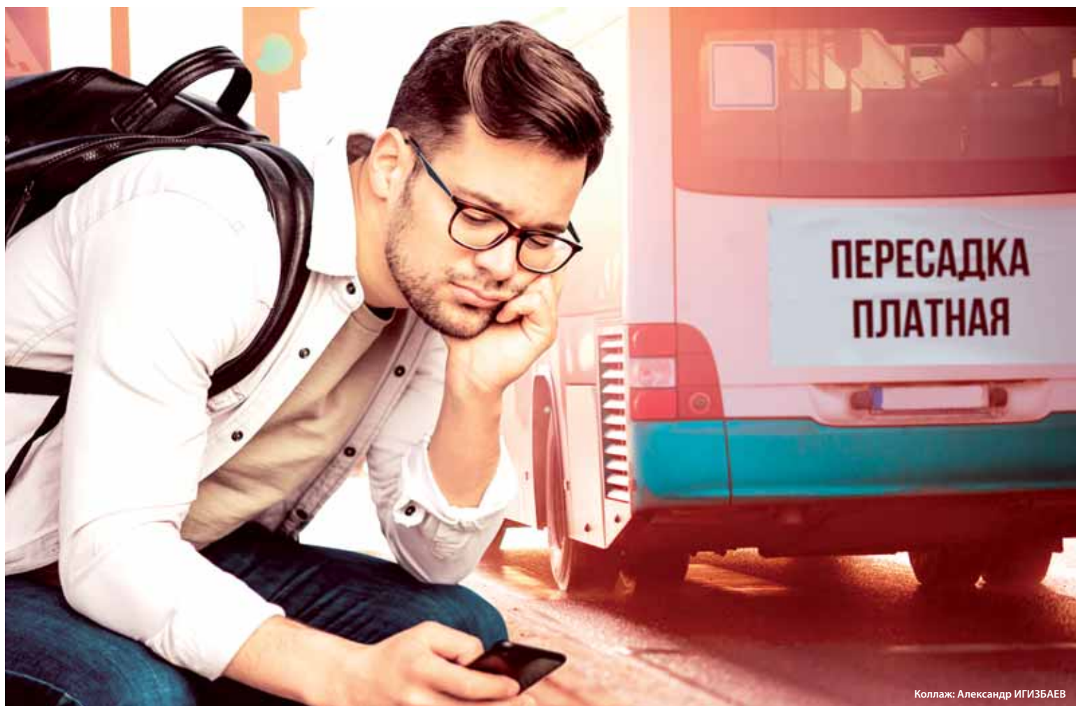
Коллаж: Александр ИГИЗБАЕВ

Такая система была введена год назад, в июле 2018 года для того, чтобы привлечь население к электронной оплате за проезд, тогда же был установлен дифференцированный тариф, когда