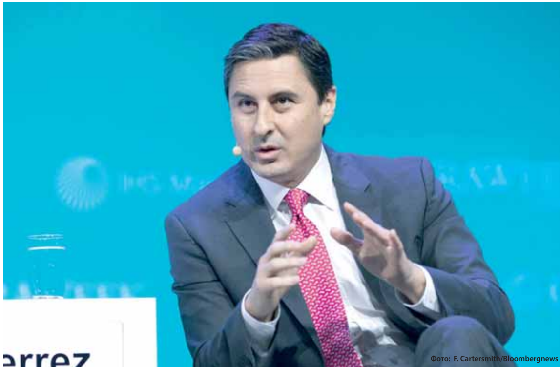
Маурисио ГУТЬЕРРЕС, президент и исполнительный директор NRG Energy, на конференции в марте. В свои 48 лет он моложе большинства руководителей компаний из списка S&P 500.

Сами руководители в возрасте до 50 лет считают, что привносят