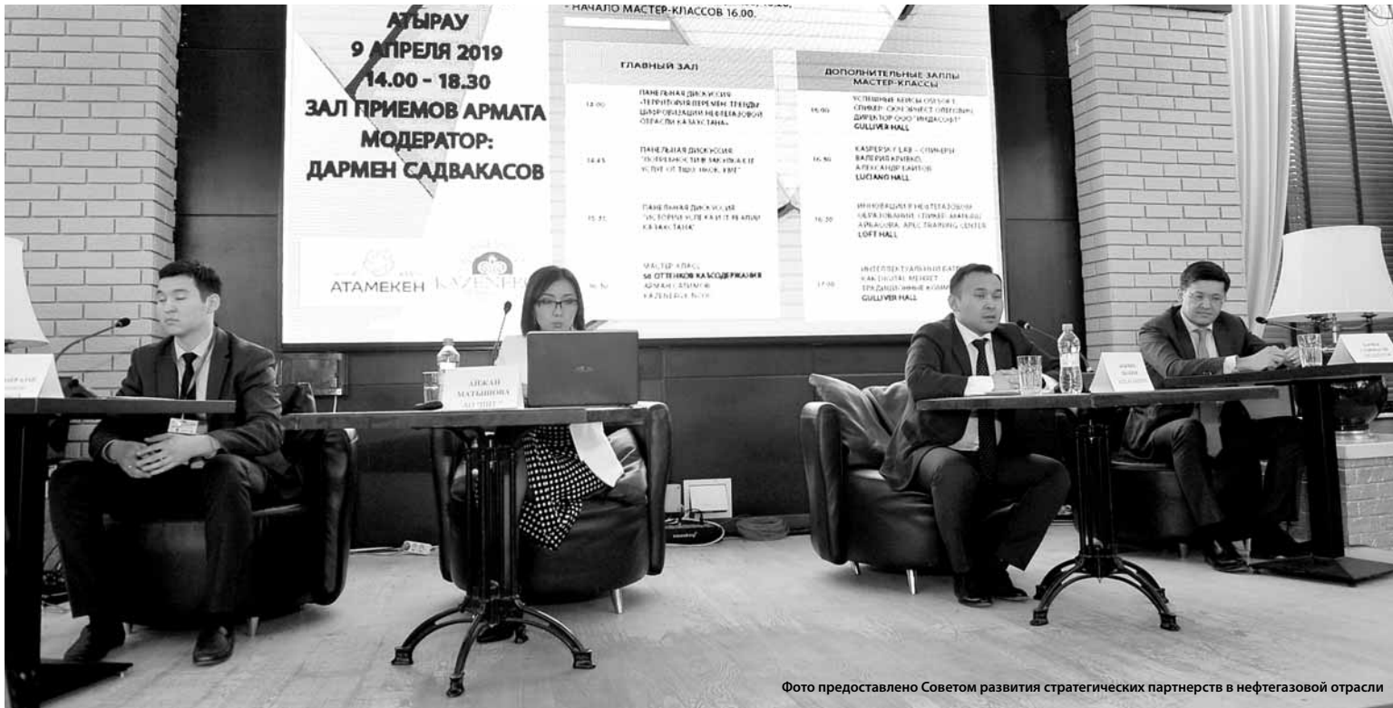
Ежегодный спрос на IT-услуги в нефтегазовой отрасли оценивается в $180 млн.

В комментариях «Курсиву» он рассказал, что на сегодняшний день в Казахстане разработано и запатентовано порядка 10 высокотехнологичных интеллектуальных продуктов. В том числе проведена разработка цифровых двойников, интеллектуальной системы видеонаблюдения, передачи данных в режиме реального времени.