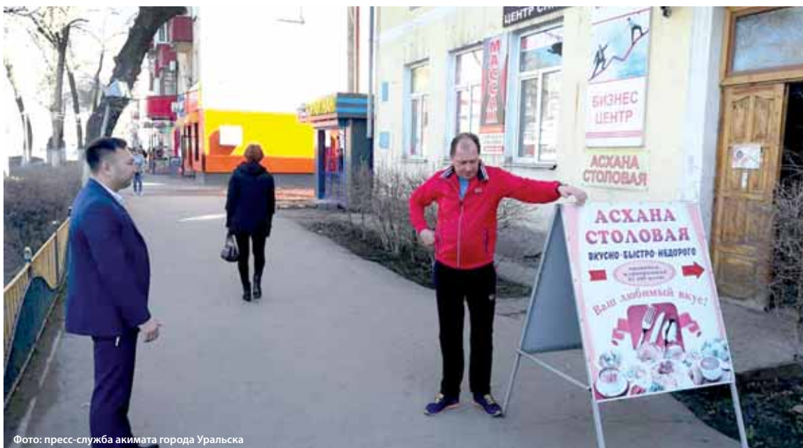
Владельцам торговых точек в Уральске дали семь дней на решение вопроса о рекламе.

По ее словам, за день было обследовано более 160 торговых точек. В ходе рейда у ряда предпринимателей были выявлены нарушения в оформлении вывесок – они должны быть написаны на двух языках, в то время как у большинства торговых точек они лишь на русском языке. Также выявлен ряд случаев размещения возле торговых точек штендров.