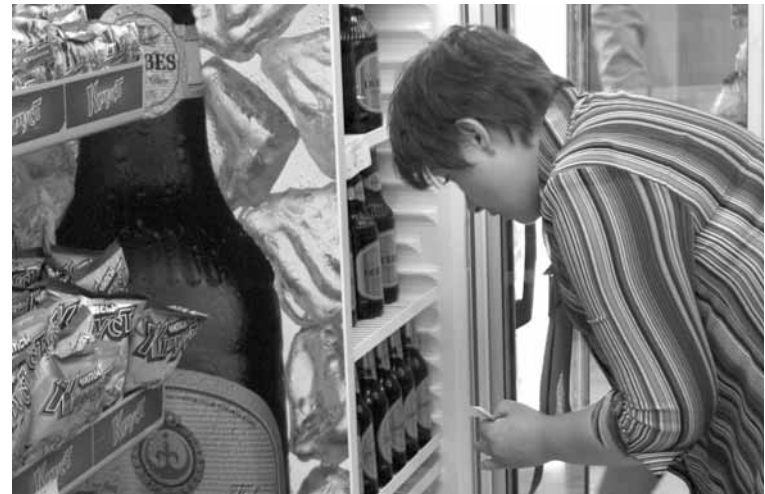
Предприниматели обвиняют полицейских в провокациях. Последние же рекомендуют бизнесменам обзавестись камерами наблюдения и обратиться в управление собственной безопасности.

В Караганде владельцы небольших магазинов снова обвиняют полицейских в провокациях