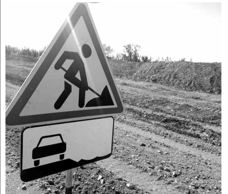
Строительство трассы Караганда – Темиртау завершат в августе 2019 года.

На строительство шестиполосного участка автобана Караганда – Темиртау предусмотрено 11 млрд 790 млн тенге, из них 9504 млн тенге уже освоено. Предполагалось, что дорогу без проблем можно будет эксплуатировать долгие годы. Ежедневно по этой трассе проезжает до 33 тысяч автомобилей, потому участок считается одним из самых загруженных. На трассе также предусмотрены транспортные развязки, первая – в районе темиртауского кольца, вторая – по улице Каршоссе, третья – по улице Дорстройматериалы и четвертая развязка – в районе пришахтинского кольца. Саму же трассу в Карагандинской области строят с большим отставанием от первоначального графика, приходится в негодность она начала уже на стадии строительства, 5,5 км из 15,5 км бетонки покрыли сквозные трещины.