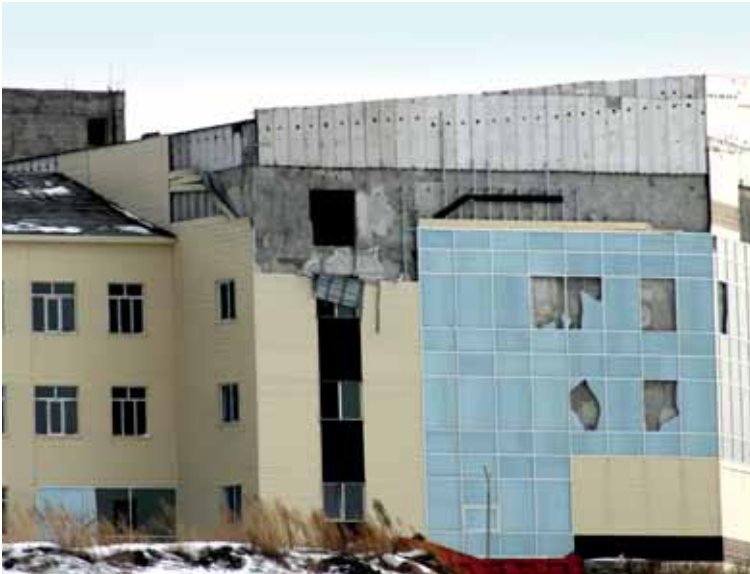
Акимат Усть-Каменогорска планирует завершить заброшенное наследство Министерства образования и науки РК.

Также заключен меморандум на разработку проектно-сметной документации для завершения строи-