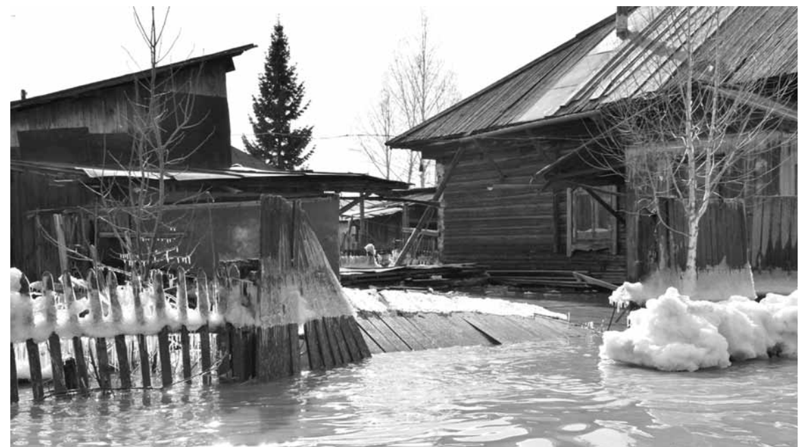
Теперь, прежде чем откликнуться на зов госорганов о помощи, предприниматели подумают дважды.

«Ситуация повторяется из года в год. Людей привлекают, ссылаются на непредвиденные обстоятельства, а потом начинают что-то выдумывать, снижать объемы работ, сочинять другие причины, чтобы не платить... Но это бизнес, на этих предприятиях трудятся люди, которым потом нечем платить за-