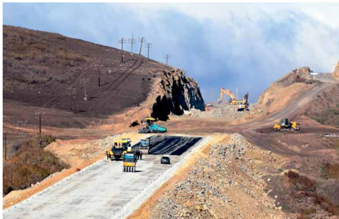
437 км дорог общего пользования планируется отремонтировать в 2019 году на 76,4 млрд тенге.

В частности, отметил глава региона, уже отремонтированы участки дорог Семей – Караул, Кокпекты – Самарское, Маканчи – Жаланашколь, Бородулиха – Шемонаиха, в целом – 236 км дорог областного значения, 27,2 км – районного. В планах текущего года – ремонт 246 км дорог областного и районного значения, причем на эти цели по