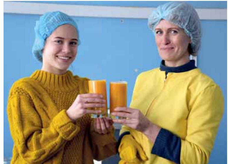
Производство тыквенного сока помогло наладить взаимопонимание между двумя поколениями.

Танцоры приготовили полторы тонны тыквенного сока