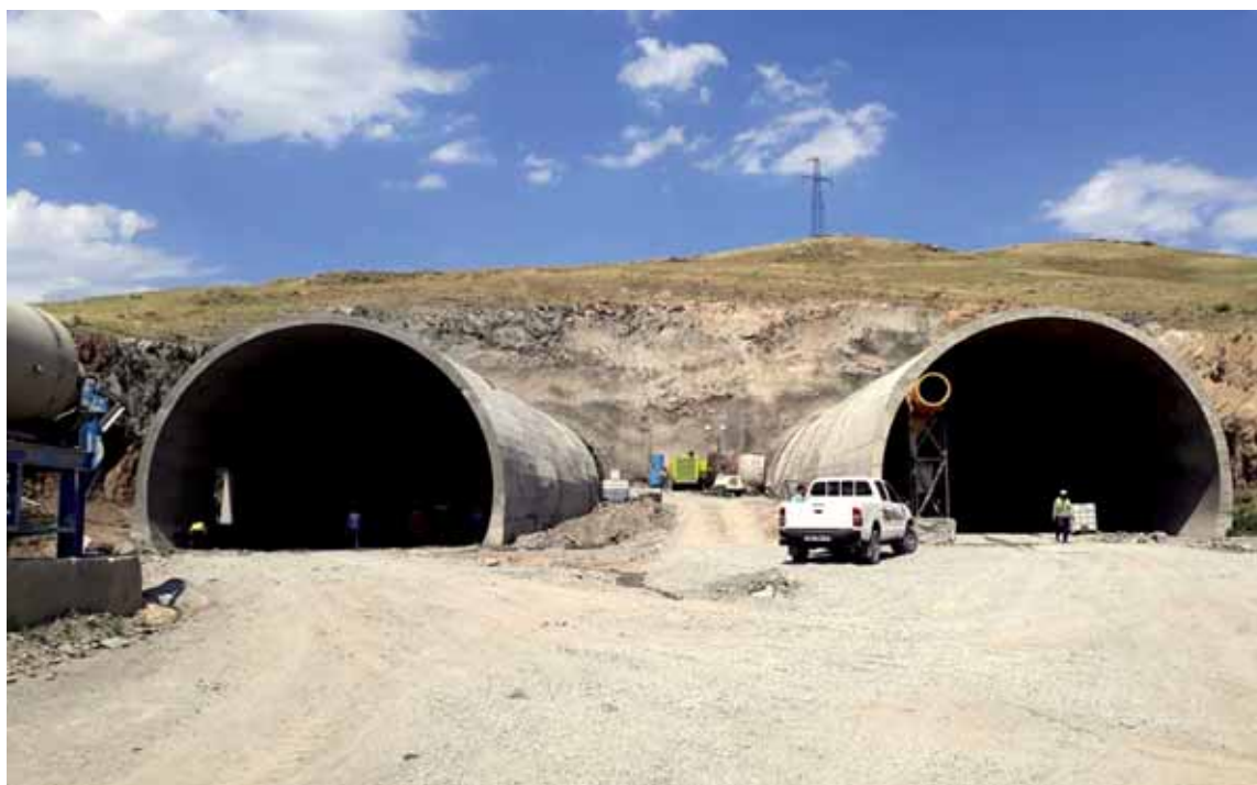
Возводимый на пути между Шымкентом и Таразом тоннель станет первым подземным в республике.

«На всех объектах дороги «Западная Европа – Западный Китай», проходящей по Туркестанской области, заказчиком выступает