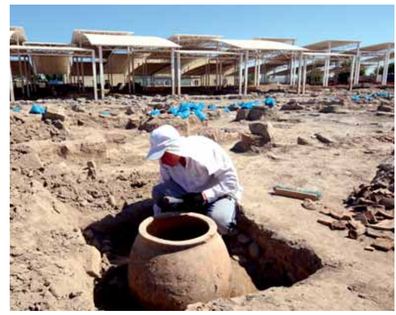
На историко-культурном комплексе «Древний Тараз» продолжают раскопки.

Сегодня в Жамбылской области насчитывается более трех тысяч историко-культурных памятников. В перечень Всемирного культурного наследия ЮНЕСКО внесены городища Баласагун, Орнек, Кулан, Костобе и дворцовый комплекс «Акыртас», расположенные вдоль Великого шелкового пути. А в список сакральных мест Казахстана включены восемь историко-культурных объектов области. Ведется работа по созданию областного союза краеведов, члены которого будут широко освещать сакральные места через СМИ.