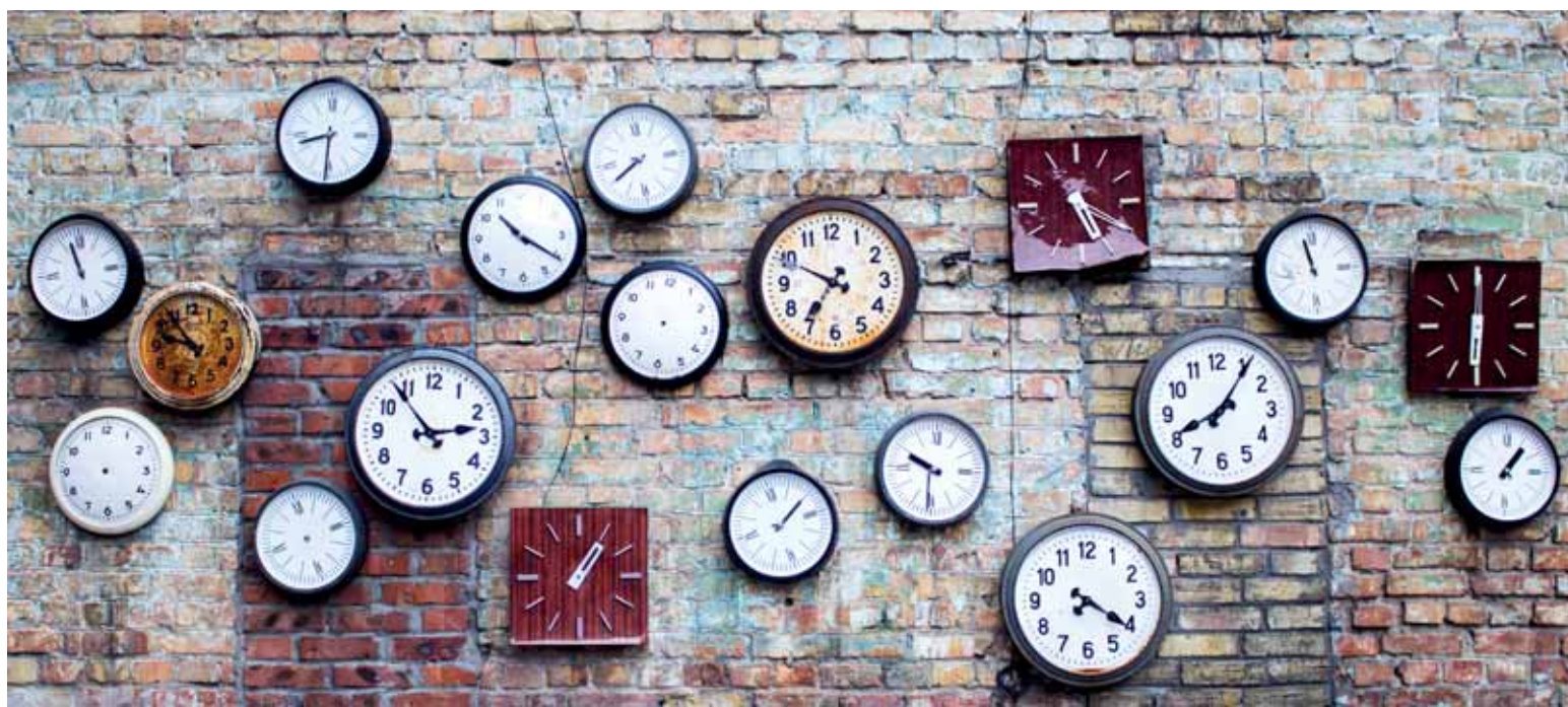
По информации акимата Кызылординской области для решения вопроса было необходимо внесение изменения в постановление в части переноса территории области из 5-го в 4-й часовой пояс. Дело осталось за малым – подписанием постановления и вступлением его в силу.

«Принадлежность» Кызылординской области к другому часовому поясу до этого фактически подтвердили госорганы. В ответе на официальный запрос «Къ» в Министерство по инвестициям и развитию РК, которому премьер-министр республики Бакытжан Сагитаев поручил всесторонне изучить этот вопрос, за подписью вице-министра Каирбека Усенбаева, было отмечено: «В соответствии с постановлением правительства РК от 23 ноября 2000 года №1749 «О порядке исчисления времени на территории Республики Казахстан» территория Республики Казахстан находится в 4-м и 5-м часовых