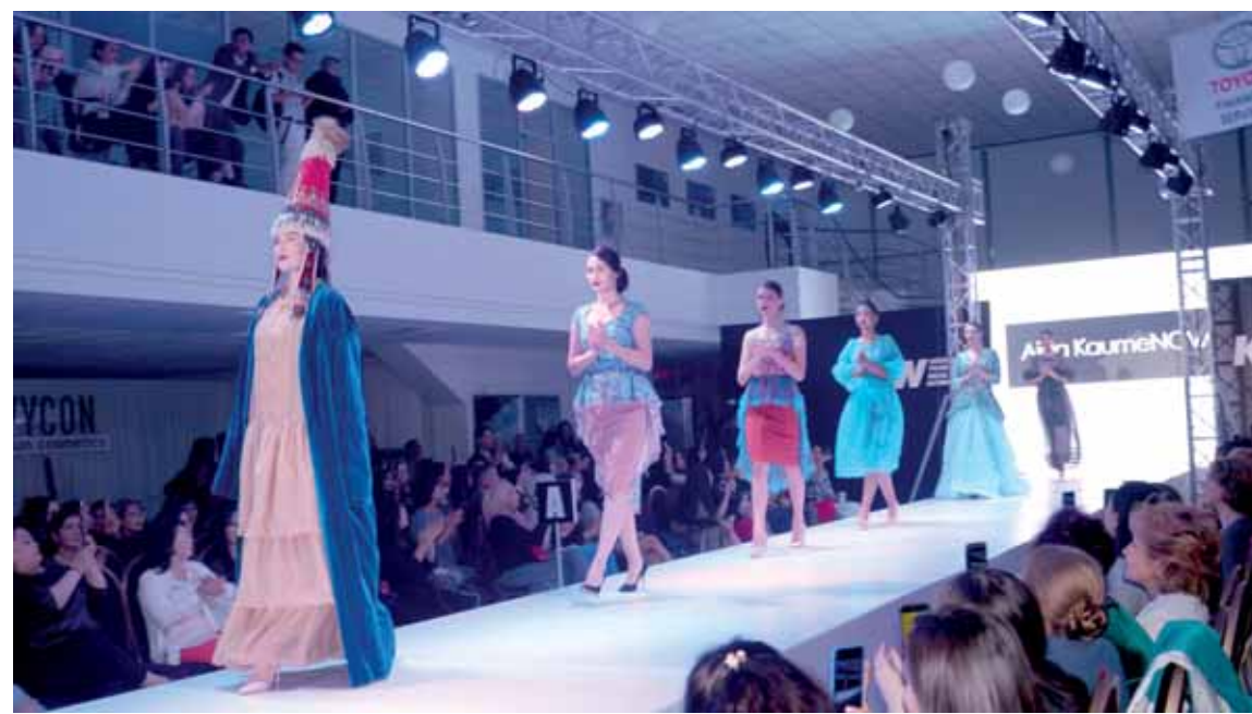
На шымкентском подиуме показали коллекции известных дизайнеров и начинающих мастеров.

Основатель и арт-директор Kazakhstan Fashion Week Алексей Чжен считает, что у шымкентских дизайнеров достаточно большой потенциал. «Мы рады, что запустили KFW в Шымкенте, – отметил он в эксклюзивном интервью корреспонденту «Къ». – Здесь существуют свои традиции, этнорисунки. Мы видим