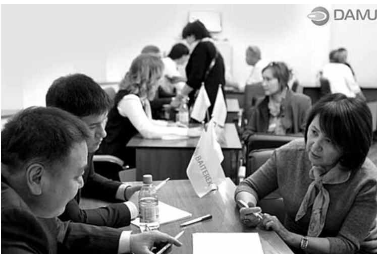
По состоянию на 01.09.2018 г. 13 БВУ, в Карагандинской области профинансировано 52 проекта на сумму 10 917 млн тенге.

По данным фонда «Даму», с 2010 года по 1.10.2018 в рамках программы «Дорожная карта бизнеса-2020» – три направления программы субсидирования и «Оздоровление предпринимательского сектора программы «ДКБ-2020» – в Казахстане подписано 12 083 проекта на сумму 2243,12 млрд тенге, сумма выплаченных субсидий составила 211,44 млрд тенге. Из них 775 проектов приходится на Карагандинскую область по трем направлениям программы суб-