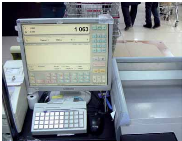
Такие аппараты упрощают работу кассиров. Но есть и минусы. Онлайн-кассы работают лишь через сим-карты, и если возникает проблема с Интернетом, то аппарат не работает.

Обещание в обязательном порядке придавать такие факты огласке должно было порадовать премьер-министра, поскольку в мае этого года он сам предлагал национальной палате предпринимателей «Атамекен» в качестве наказания вывешивать на входных дверях торговых точек, где были обнаружены некачественные продукты, значок «Не доверяю». Так что министр услышал и готов реализовать его идею, пусть и не в столь радикальной форме, в какой она предлагалась. Осталось дождаться ответа на вопрос, услышали ли его спич относительно мониторинга цен в акиматах.