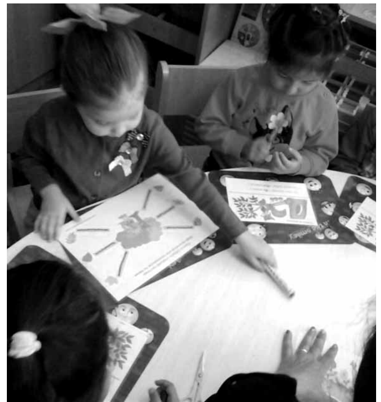
Детский центр развития и социальной адаптации «Улкен журек» единственный в городе, где работают с детьми с ограниченными возможностями.

Детский центр развития и социальной адаптации «Улкен журек» открылся в Балхаше в сентябре 2011 года. Это первый и на сегодня единственный центр в городе, где работают с детьми с ограниченными возможностями. В течение года занятия здесь проходят около 75 человек до 18 лет с разными заболеваниями. У большинства диагнозы ДЦП, синдром Дауна, отставание в развитии. Занимаются дети в арендованной четырехкомнатной