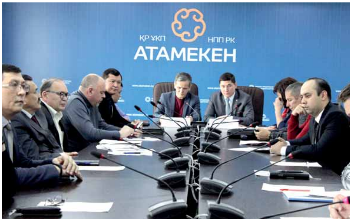
На заседании комитета строительства предприниматели пришли к решению, что им требуется помощь антикоррупционной службы.

Суть коррупционной схемы состоит в том, что лжепредприниматели ввозят товар в страну, проходят таможенный контроль и отзывают документы, мотивируя это тем, что ввоз импорта якобы не состоялся. Тем не менее нарушители закона продают товар фирмам-посредникам, которые, в свою очередь, сбывают его официальным покупателям. Все это время ведения данного бизнеса. Пока товар не попадает к легальному покупателю. И лишь после этого департамент госдоходов начинает возбуждать производственные дела в отношении легальных предпринимателей. Чаще всего подоб-