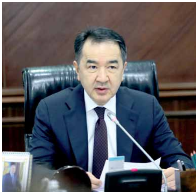
«Помимо физической доступности продовольственных товаров, важно, по какой цене продукты доходят до конечного потребителя», – сказал глава кабинета, обращаясь к акиму столицы.

О меморандумах глава правительства вспомнил в связи с тем, что проект «Дорожной карты» предполагает строительство нескольких крупных ферм, а также объектов инфраструк-