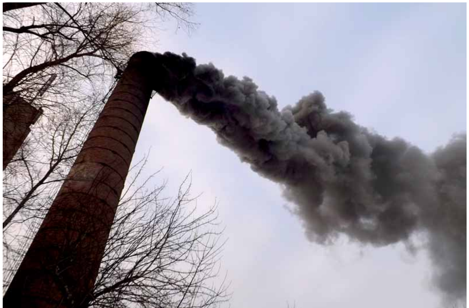
Из-за управленческих ошибок 96 млн тенге вылетели для тепловиков в трубу.

«Благодаря собственной выработке электроэнергии, у предприятия образовалась экономия. Если бы руководство своевременно обратилось к нам с этим вопросом, мы бы смогли на законных основаниях провести корректировку тарифной сметы и пустить сэкономленную сумму на другие нужды этой же компании. Ведь сегодня в «Теплокоммунэнерго» не хватает на приобретение угля