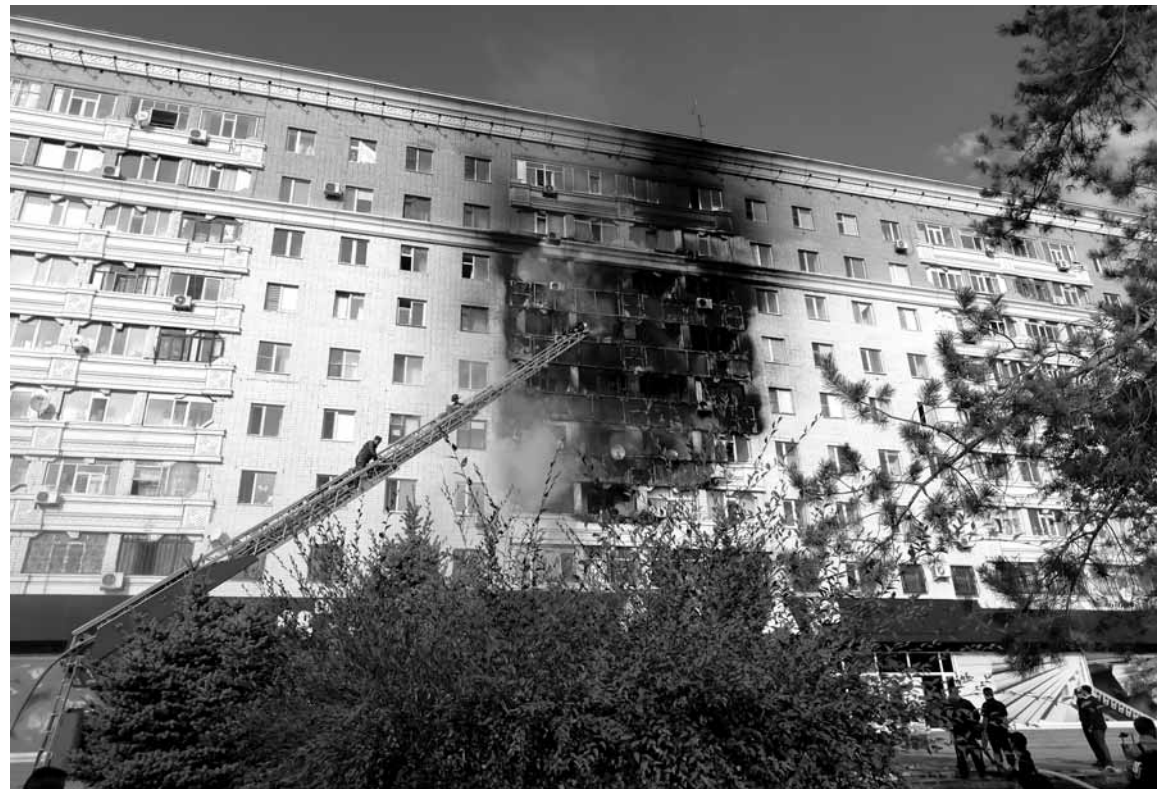
Жителей многоэтажки до приезда пожарных из квартир выводили очевидцы.