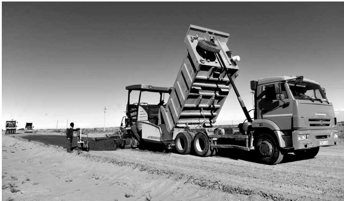
Стоимость реконструкции автодороги от города Атырау до границы с Астраханской областью России протяженностью 277 км составит 92 млрд тенге.

Сейчас, как говорилось выше, идут подготовительные работы: