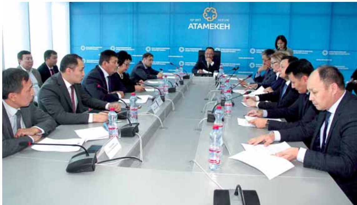
По словам представителей Совета по защите прав предпринимателей ЗКФ НПП, раз на их запросы по ситуации с объектами никто не отвечает, значит за этим кроется какая-то тайна.