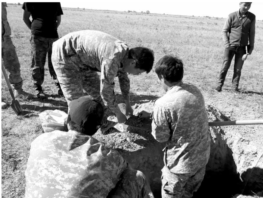
Чтобы взять образцы почвы на лабораторный анализ, нужно сделать правильный разрез на поле.

«В этом году семь образованных бригад, каждая из которых состоит из водителя, инженера-почвовед и двух рабочих, выехали в поле с начала апреля, как только позволила погода. Причем образцы можно брать только в хорошую погоду, так как дождь мо-