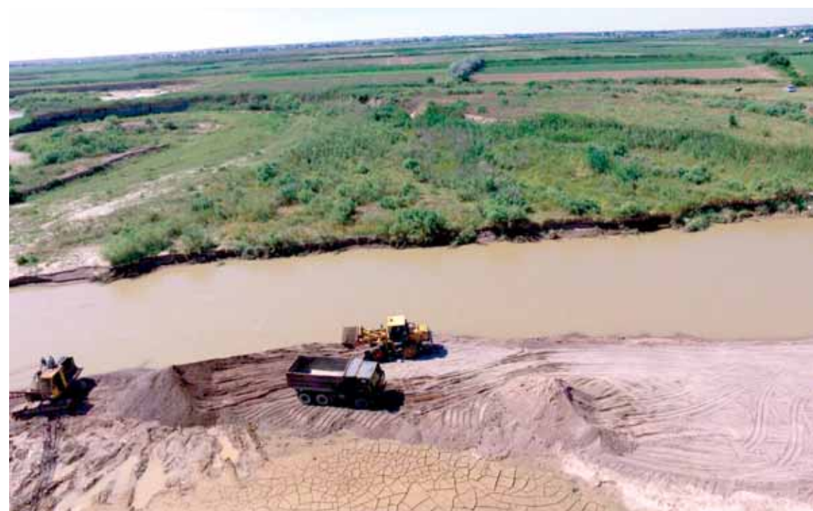
Борьба с незаконными природопользователями в Туркестанской области пока не приносит действенных результатов.

А между тем контракт выдается сроком на 25 лет. И ровно на этот же период выдается разрешение, на предпринимательскую деятельность недропользователя. По словам Мурата Садыкова, при-