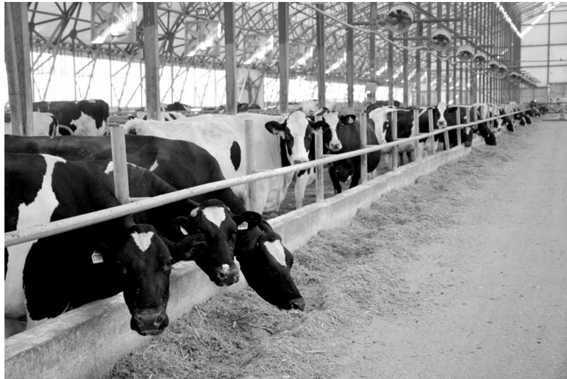
На молочной ферме в Арыси 560 высокоудойных коров породы голштин дают по 14–15 тонн молока в сутки.

В 2017 году ТОО «Казынажер ЛТД» выделялось 213 млн 775 тыс. тенге. Из них на удешевление молока – 109 млн 351 тыс. тенге, на удешевление корма – 104 млн 424 тыс. тенге. Отметим, что, по