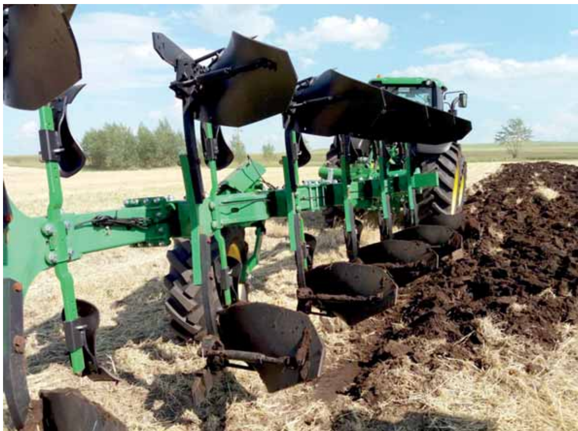
Кустарные запчасти, закупаемые на рынках, нередко становятся причиной поломки сельхозтехники во время сбора урожая.

В КХ «Ер-Али» Жалагашского района 1400 га риса. Скошено уже 1200, обмолочено 1000 га. Жатву здесь начали позже обычного – из-за того, что рис поздно созрел. Уборка риса началась 28 сентября, но хозяйство уже не раз меняло на технике ремни, подшипники и другие запчасти. Покупали их на рынках, где цены поднимаются два раза в год: весной, когда идет посевная, и летом, когда начинается жатва.