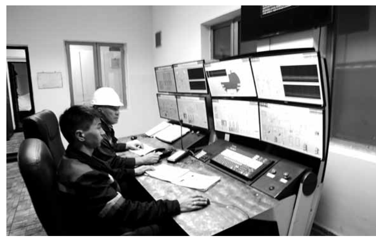
В 2018 году руководство завода намерено привлечь инвестиции в размере 12 млрд тенге.

Предприятие также направляет огромные финансовые средства на поддержание экологии. Каждый год в целом по «Казфосфату» на природоохранные мероприятия расходуются около 650 млн тенге. Но, вкладывая в новые технологии, фосфорщики выигрывают не меньше. Технология утилизации