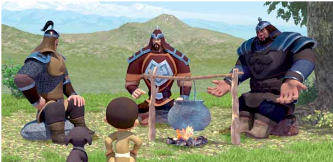
Аниматоры предполагают, что их продукт поможет детям лучше узнать историю своей Родины.

Завершается работа и над анимационной лентой «История Салыса», режиссером которой стал