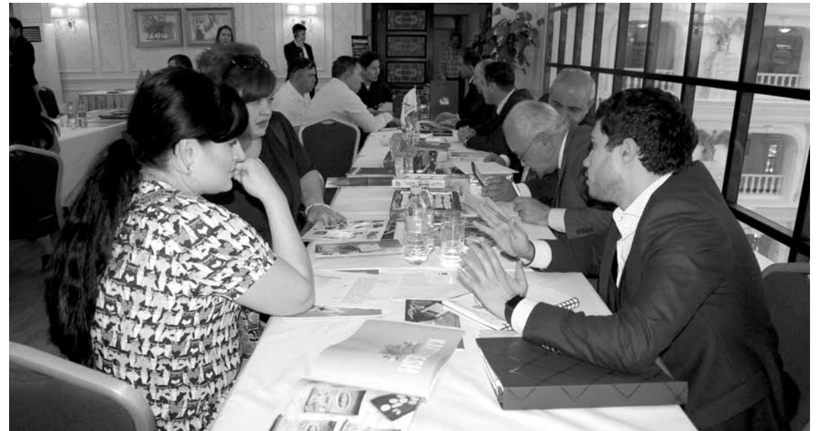
Представители почти трех десятков компаний из Азербайджана прибыли в Шымкент в поисках партнеров.

Двустороннее сотрудничество налаживают южноказахстанские и азербайджанские бизнесмены