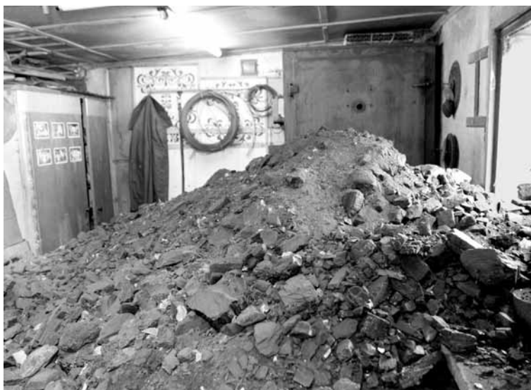
Всего в Усть-Каменогорске 1699 многоквартирных жилых домов. 50 из них до сих пор не готовы к приему теплоэнергии, отмечают представители ЖКХ города.

Впрочем, готовность теплоцентрали дать тепло совсем не означала готовность многоэтажек это тепло принять.