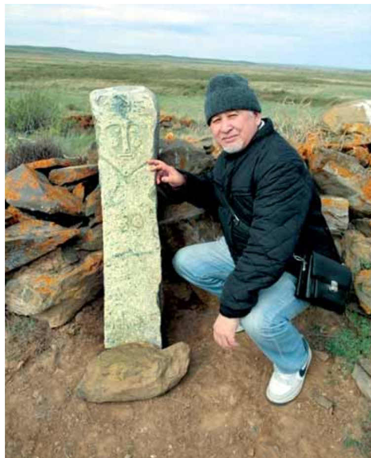
Это не просто каменные насыпи, а памятники историко-культурного наследия. Их уничтожение необходимо предотвратить, уверены ученые.