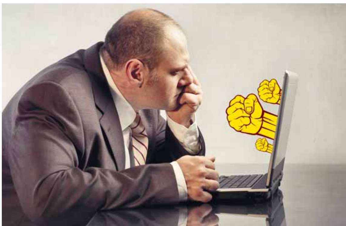
Профсоюзы настроены решительно. Даже подали заявку на проведение митинга. Представители местной власти попытались договориться с профсоюзами, но диалога не получилось. Коллаж: Александр ИГИЗБАЕВ

Одна из главных причин столь решительного шага – увеличение ежемесячных финансовых поступлений из регионов.