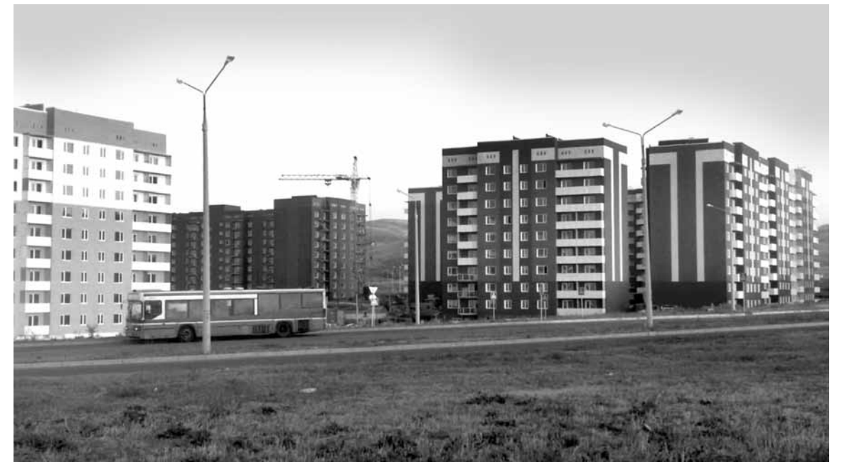
В левобережной части Усть-Каменогорска наблюдается строительный бум. Но достаточно ли этого, чтобы расселить всех желающих?

Но, если представить, что в крупные города региона передедут все сельчане, оставшиеся без работы, то рынку труда Восточного Казахстана придется столкнуться с новыми сложностями. Специалисты департамента прогнозирования АО «Центр развития трудовых ресурсов» Минтруда считают, что одной из главных проблем в сфере занятости ВКО является несоответствие нужных профессий и предложенных резюме. Несмотря на то, что Восточно-Казахстанская область относится к регионам с недостатком рабочей силы, вакансий по техническим специальностям очень много (около 15 тыс. в 2018 году – «КЪ»).