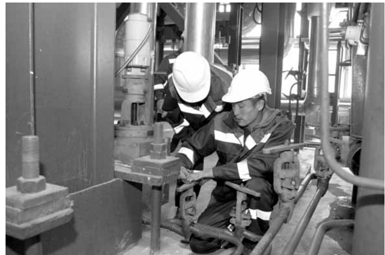
Отопительный сезон в Семее стартовал 1 октября.