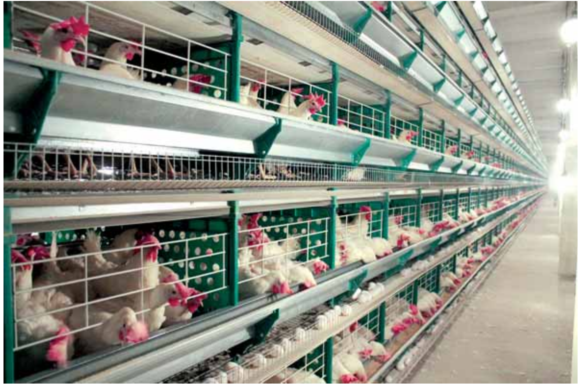
Птицефабрика в Рудном планирует построить оцифрованный племенрепродуктор.

Костанайская область погрузилась в пилотный проект по использованию новых технологий