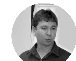
«Школы скрывают от людей реальные возможности фонда всеобуча».

Закон РК «Об образовании» предписывает полностью или частично компенсировать расходы на содержание детей, нуждающихся в поддержке во время получения образования. Оказание материальной помощи из фонда за счет бюджетных средств – одна из форм. «Для обеспечения правильного распределения средств из фонда всеобуча при общеобразовательном учреждении создается комиссия в количестве трех-пяти чело-