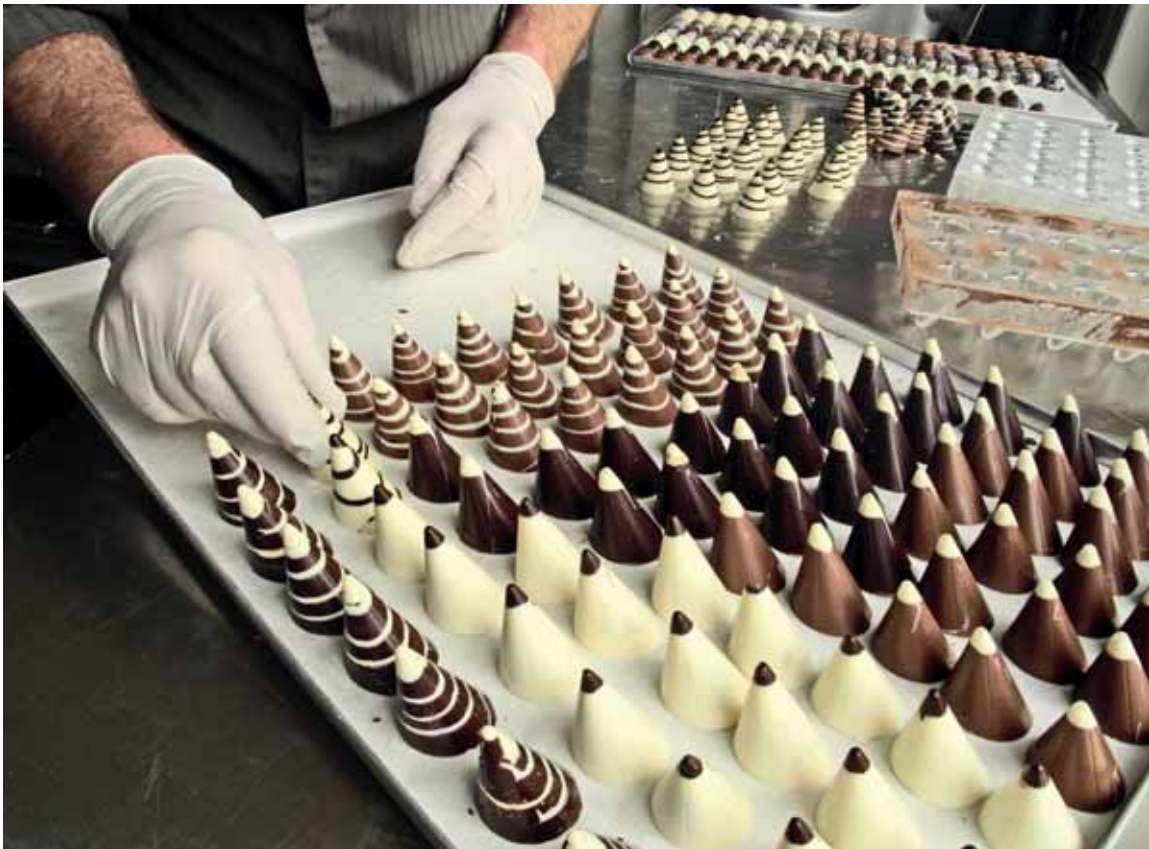
Казахстанцы третий год отстаивают право сладкого продукта на натуральность.

В основном это горнодобывающие предприятия. По словам министра, сейчас неизвестно, сколько человек в результате модернизации останется за бортом, но эти риски поручено акимату Костанайской области просчитать, и как можно быстрее. Пока предлагаемое решение – помочь этим людям получить новые специальности.