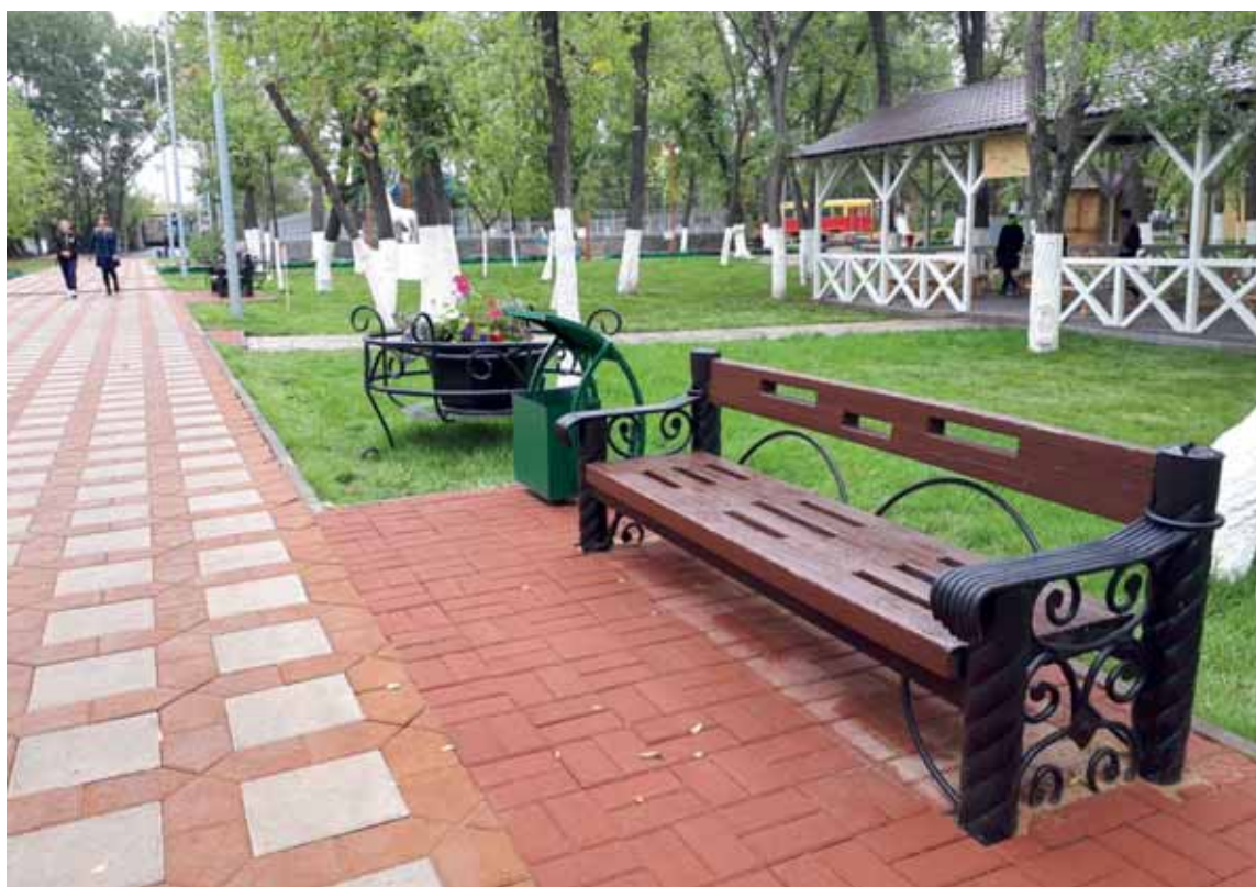
Торжественное открытие отреставрированного парка в Темиртау состоялось 7 сентября.

Зачем местные власти вновь разорили парк?