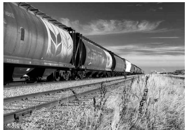
9 октября в АО «НК «КТЖ» начнет работу штаб по организации перевозок зерна. Кроме того, при Костанайском и Акмолинском отделениях железной дороги будет вестись круглосуточная работа по погрузке и выгрузке зерна.

Убытки карагандинские мелькомбинаты терпят к тому же из-за