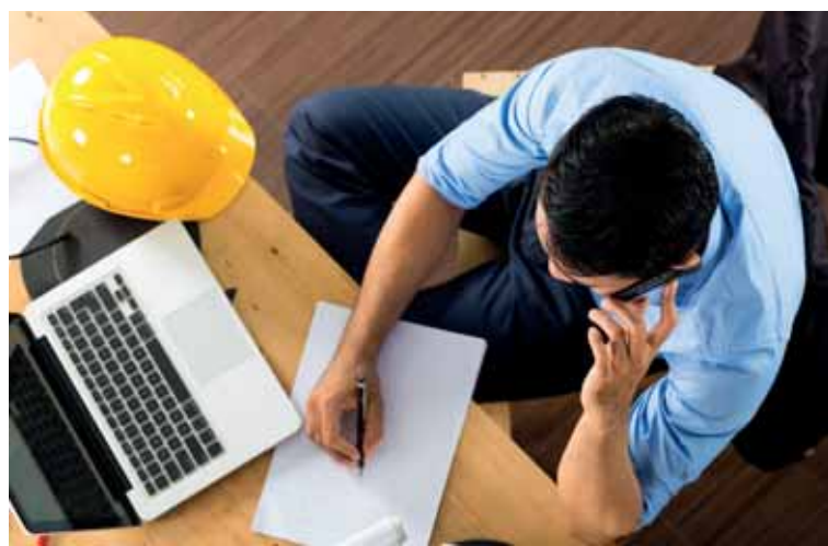
Налогообложению не подлежат самозанятые, имеющие доход ниже установленного минимального заработка.

Сотрудники центра ведется правая разъяснительная работа и по пенсионным отчислениям, и по медицинскому страхованию. Не только в подворовых обходах,