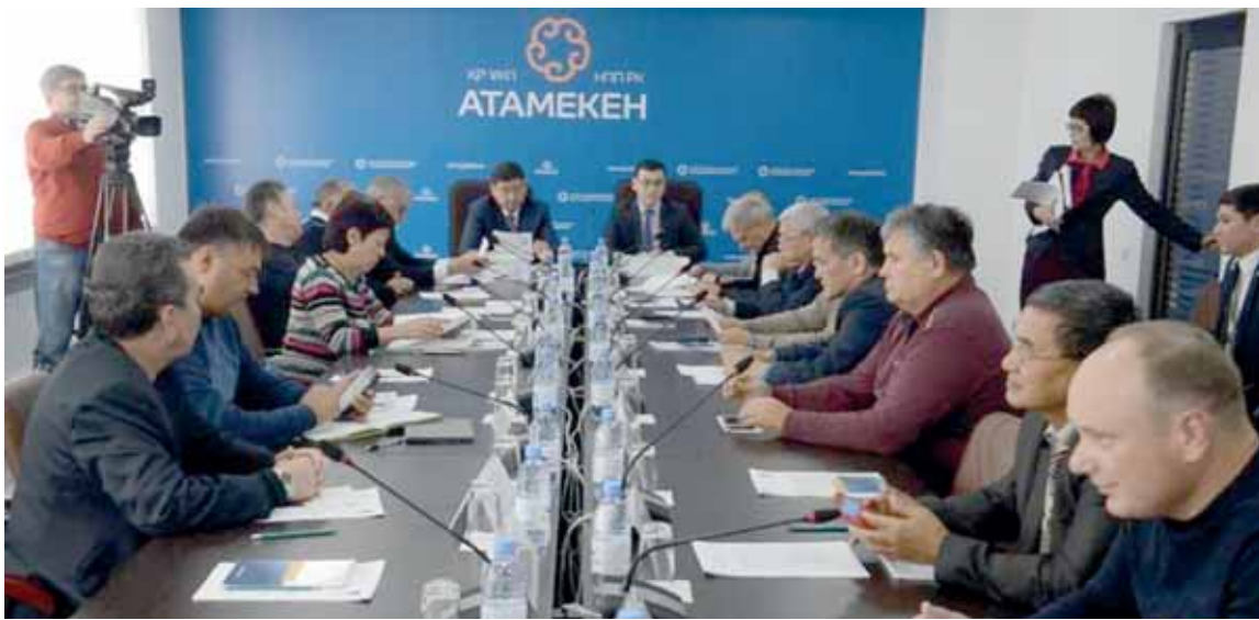
Недавно созданный комитет горнодобывающего комплекса намерен отстаивать права предпринимателей.

Карагандинские горняки хотят привлечь инвесторов в регион. По их мнению, существующий горный кодекс пока не работает в полной мере.