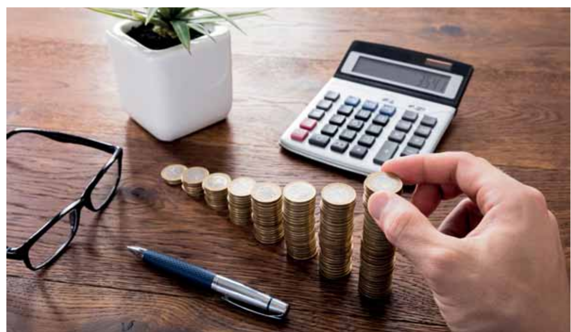
Завершением срока налоговой проверки считается день вручения налогоплательщику акта налоговой проверки.

По словам экс-предпринимательницы, получив извещение, она решила поехать в Балхаш, чтобы разобраться с проблемой на месте. «В городском управлении госдоходов специалистов, работавших 10 лет назад, уже не было, а пришедшие вместо них понятия не имели о моем заявлении. Я написала повторное заявление о прекращении предпринимательской деятельности