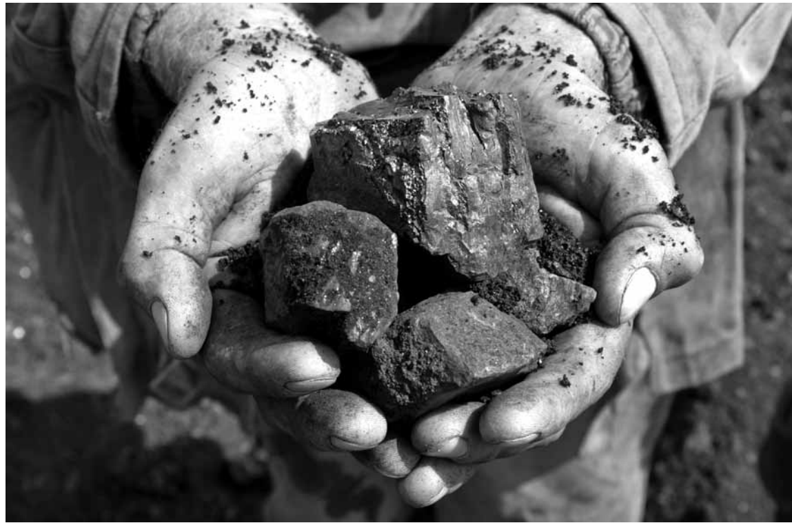
На проведение геологического изучения недр на территории РК предполагается выделить 6,2 млрд тенге бюджетных средств, на 2020 год – 7,0 млрд тенге (при уточнении бюджета могут быть внесены изменения).

Инвестиции же частных компаний в геологоразведку за счет собственных средств по договорам ГИН в период с 2015 года по июль 2018 года по Карагандинской области составили 6 193 711 747 тенге. В том числе в 2015 году – 605 235 038 тенге, в 2016 году – 185 661 792 тенге, в 2017 году – 791 201 777 тенге, с января по июль 2018 года – 788 522 521 тенге. Талгат Сатиев отметил, что в данное время за счет собственных средств недропользователей (по договорам) на терри-